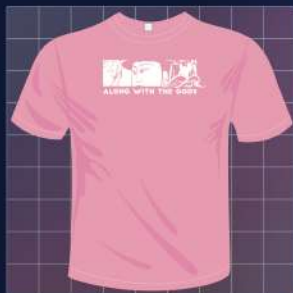
▲ 與神同行印花紀念衫