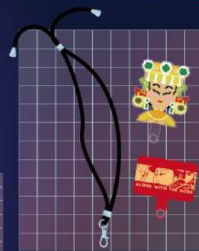
▲ 媽祖BO平安手機掛繩 (兩款手機掛片+一條手機繩為一組) (手機掛繩顏色隨機)