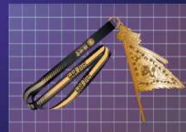
▶ 完跑令旗紀念獎牌