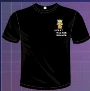
▲ 8bit媽祖電玩風紀念衫