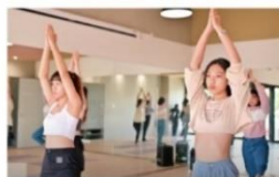
地板教室 (多功能空間)