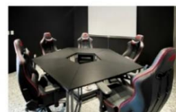
手遊電競室 (影音及投影設備)