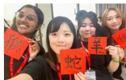
跨國混班、國際交流