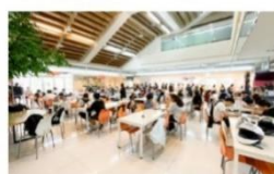
寬敞明亮學生餐廳