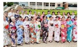
異國文化體驗活動