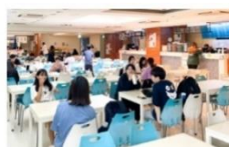
興國美食街 (饅/日/韓/泰/麵/川菜)

百貨商場級美食街多樣性餐飲選擇，由專業營養師督導餐飲衛生，讓全校師生都能吃得健康。