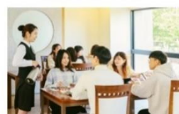
弘樓館 (精緻餐飲、專業服務)