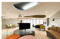
交誼廳 (影音及投影設備)

刷卡管控智慧型生活宿舍，設有智慧超商、健身房、電競室、文書處理站、餐飲 DINING 等。