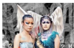
各系展演、走秀活動